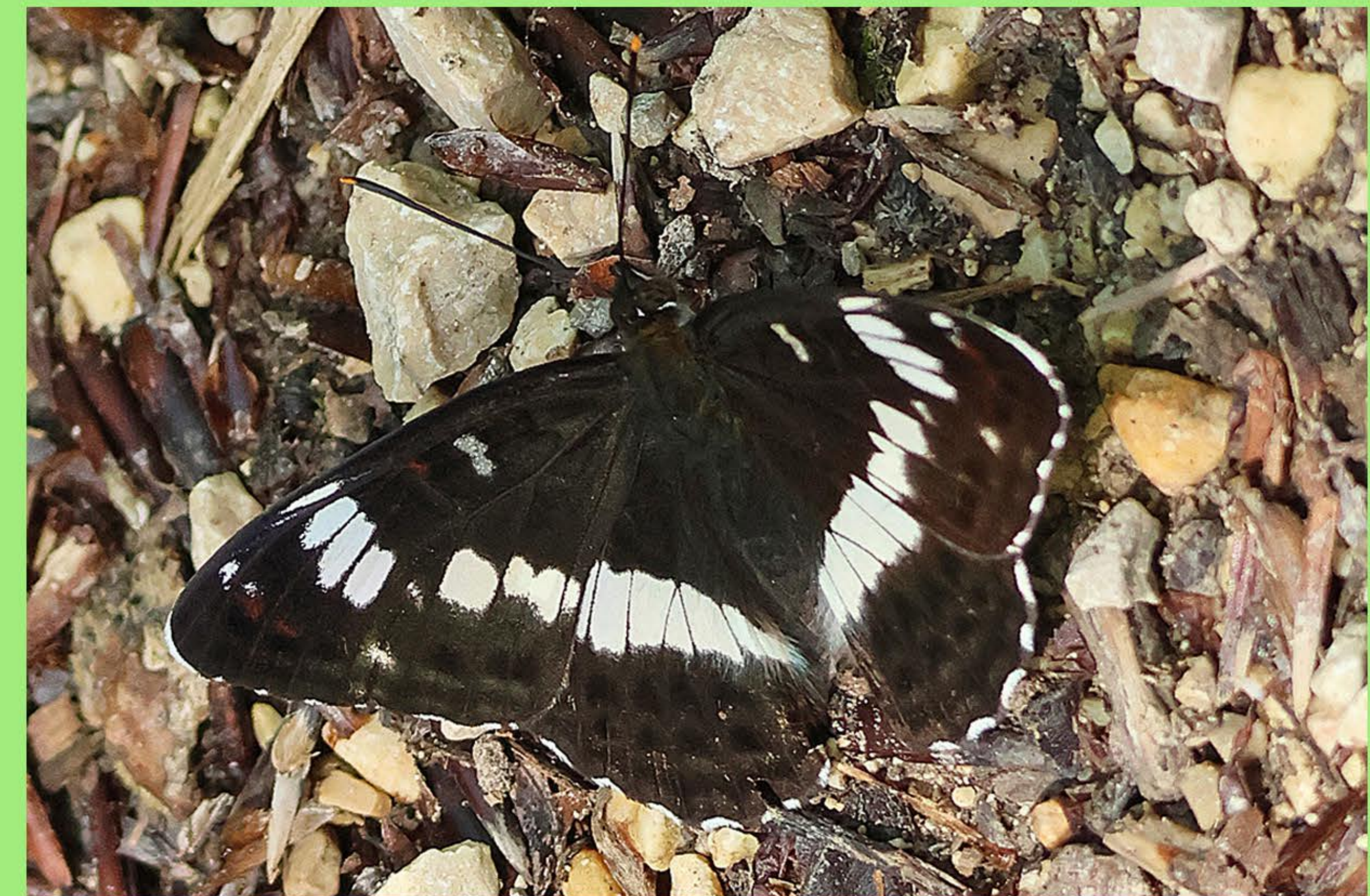
Kleiner Eisvogel Rote Heckenkrische