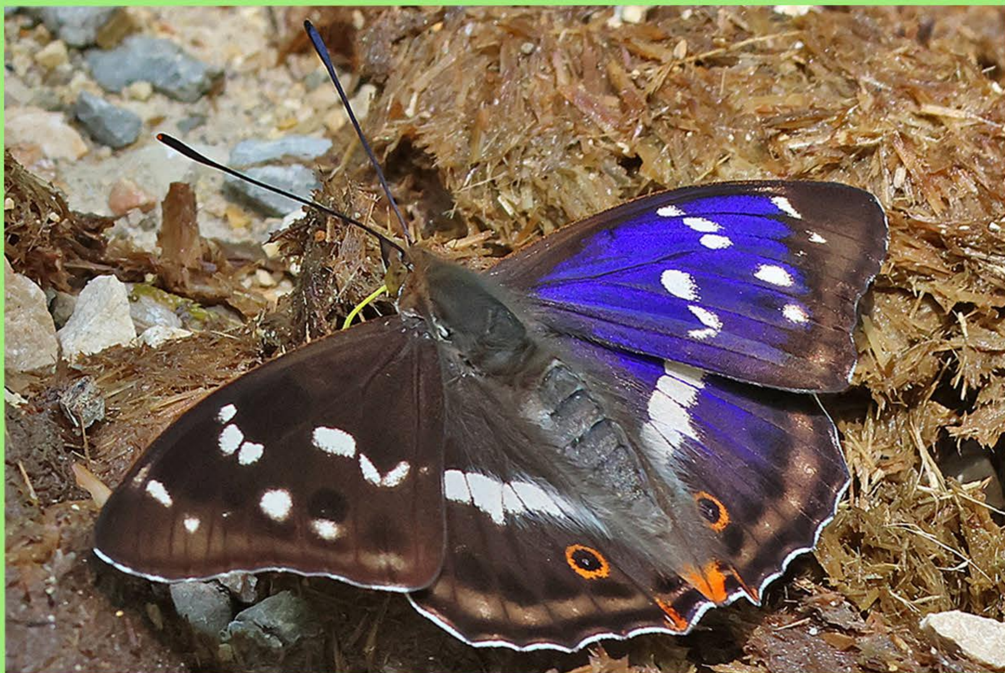
Großer Schillerfalter Salweide

Wusstet ihr, dass einige der schönsten Tagfalter ihren Lebensraum im Wald haben ? Denn dort finden die Raupen ihre Nahrungspflanzen