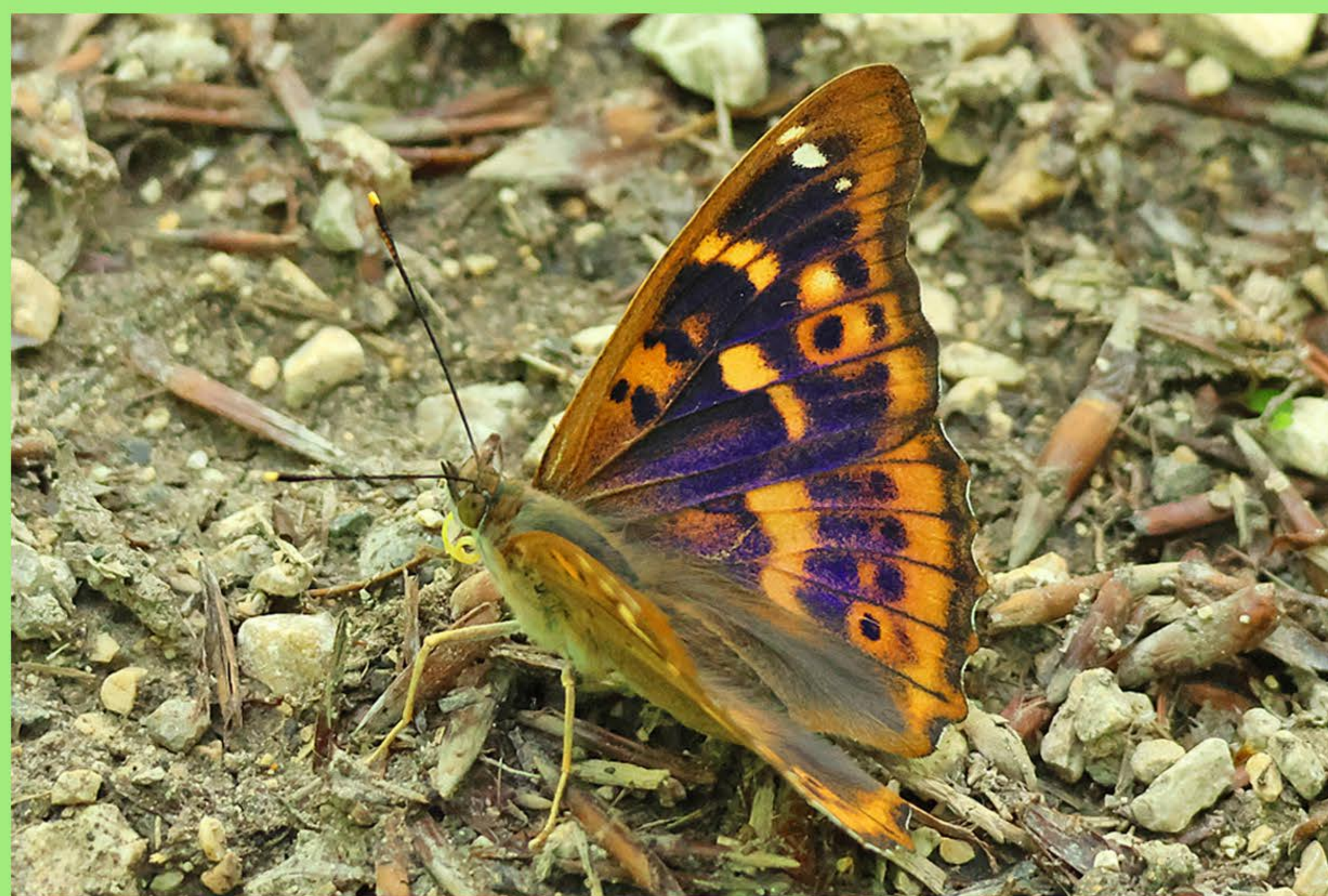
Kleiner Schillerfalter Zitterpappel