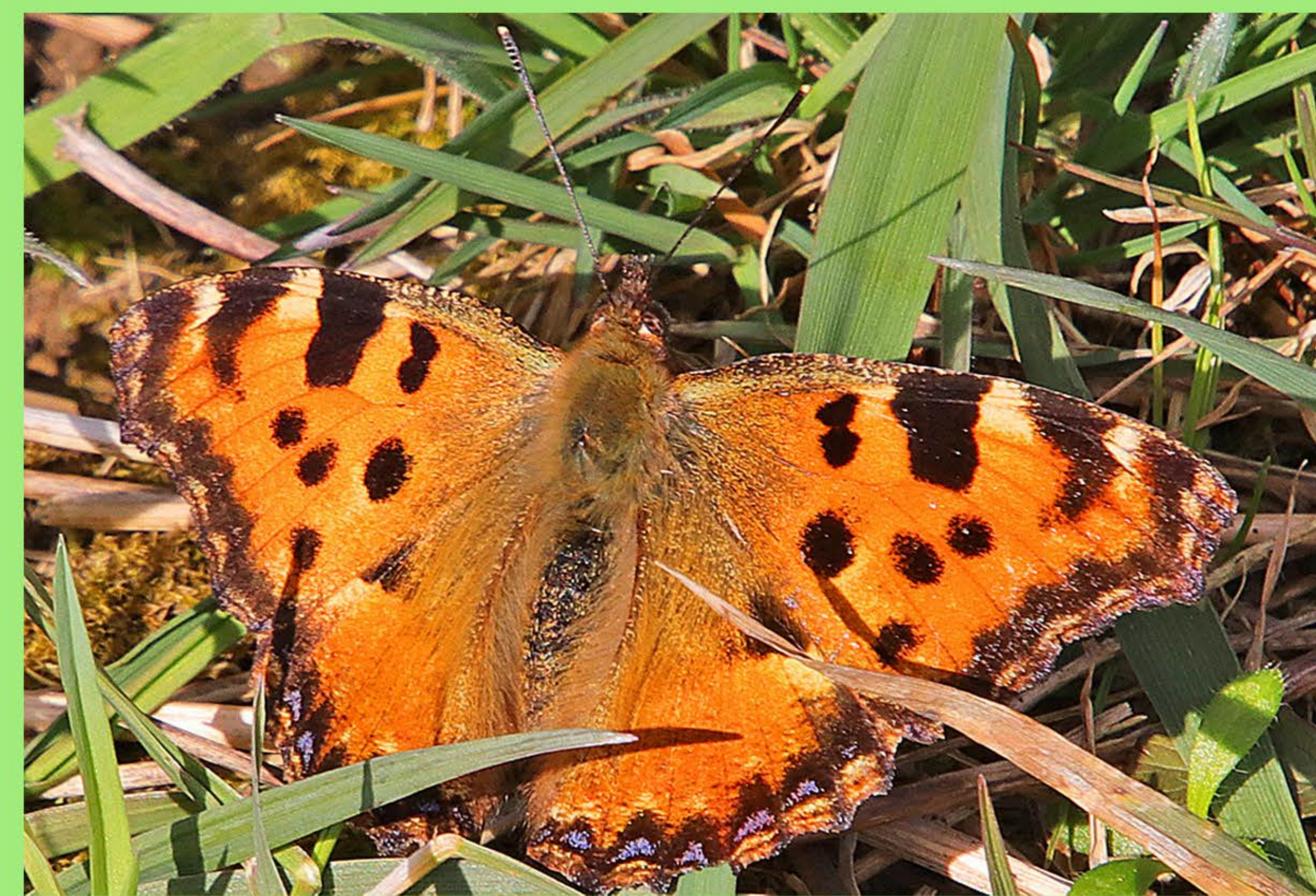
Großer Fuchs Kirsche, Ulme, Weide