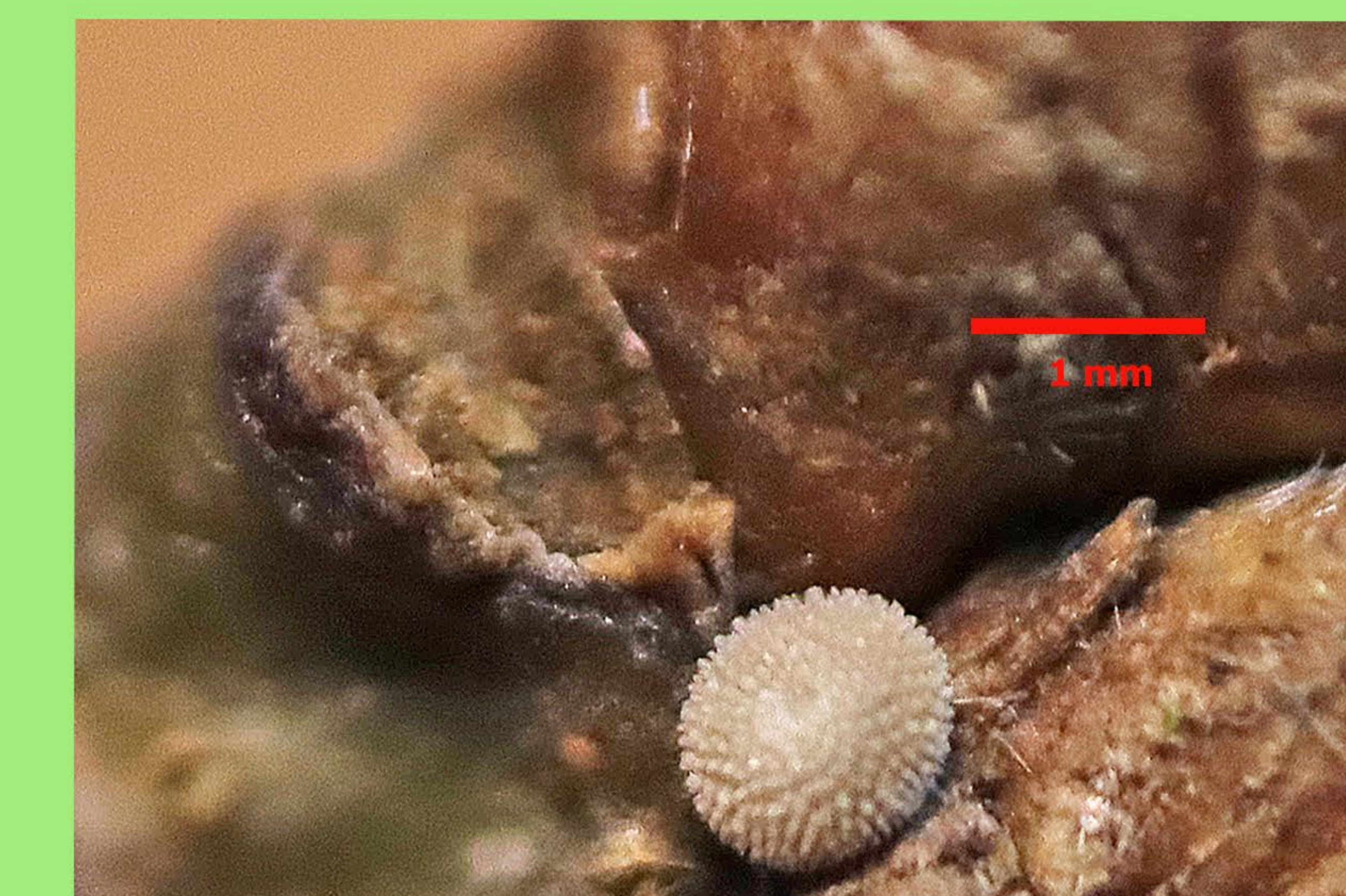
Ei Blauer Eichen-Zipfelfalter Eiche

In einem naturnahem Wald sollte möglichst keines dieser Gehölze völlig fehlen